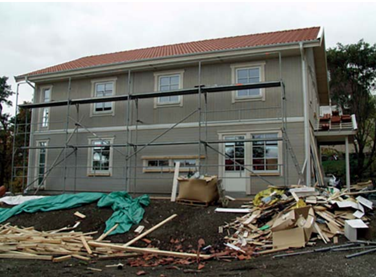
...som också tror att färre småhus och...