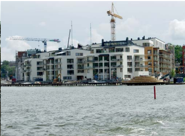
...bostadsrätter kommer byggas.