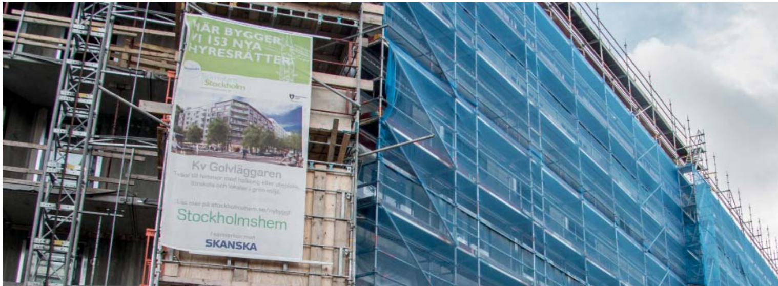
Fler hyresrätter kommer att byggas tror Industrifakta...